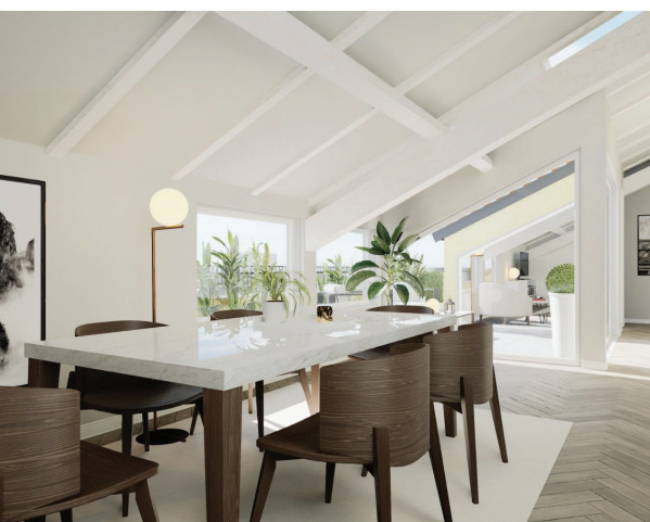
CONTATTI: INFO@EDILPLUSRL.IT E +39 024882315

perché si distingue dalla concorrenza? Innanzitutto, la società può contare su un vasto organico che permette di garantire ai clienti servizi a 360 gradi, tutti svolti da personale interno. Questo tipo di organizzazione consente una gestione dei costi migliore e un servizio puntuale ed efficiente "chiavi in mano" rivolto al cliente, che dovrà semplicemente affidarsi ai professionisti che si occuperanno personalmente di tutte le fasi del progetto per garantire un risultato finale aderente alle aspettative dell'utente. Le consulenze, quindi, sono altamente personalizzate; il cliente risparmierà il proprio tempo perché dialogherà unicamente con un solo interlocutore, il team di Edilplus che, con competenza e gestione ottimizzata delle pratiche, riesce a realizzare in maniera virtuosa i progetti, dai più piccoli a quelli più ambiziosi. Il cliente, allo stesso tempo, interfacciandosi con un architetto di riferimento, è costantemente al corrente di tutti i passi in avanti nella progettualità, grazie a render ad alta definizione. Attraverso l'utilizzo di software per la modellazione architettonica 3D e il rendering, il progettista è in grado di manipolare i progetti in tempo reale, passando rapidamente dal concetto al concreto con l'obiettivo di fornire al cliente la panoramica più vicina e realistica a quello che potrebbe essere il risultato finale, con la possibilità di apportare eventuali aggiustamenti prima della fase di realizzazione materiale.